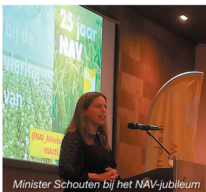
Minister Schouten bij het NAV-jubileum

Natuurlijk is de belangenbehartiging nooit af. In dit nieuwe jaar gaat de NAV zich o.a. sterk maken voor rendabele aardappelteelt, invulling van de kringlooplandbouw, effectieve gewasbescherming door behoud van een effectief middelenpakket en versnelling van de toelating van groene middelen, verdere toename van de teelt van eiwitgewassen en natuurlijk voor het GLB na 2020. En bij alle ontwikkelingen blijft natuurlijk het speerpunt van de NAV dat boeren een behoorlijk inkomen uit de markt moeten kunnen halen. Daarom hebben we in februari als thema voor ons jaarcongres gekozen voor 'nieuwe verdienmodellen bij nieuwe ontwikkelingen'. Het kan immers niet zo zijn dat er steeds meer eisen worden gesteld die kosten en risico's met zich meebrengen voor boeren zonder dat deze betaald worden! NAV