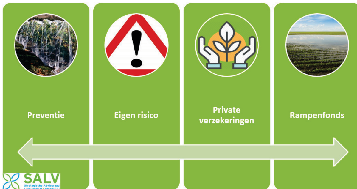
Figuur 1 Het Rampenfonds vormt een onontbeerlijk component binnen een evenwichtig risicobeheer

de toepassing gebaseerd wordt op evenwichtige drempels inzake verantwoordelijkheid en blootstelling. 11