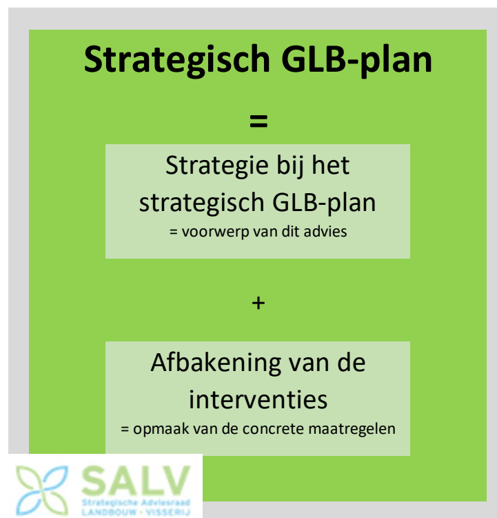
Figuur 1. Voorbereiding van het strategisch GLB-plan. Het voorwerp van onderhavig advies is de strategie bij het strategisch GLB-plan

De ambtelijke voorbereiding van het GLB-plan in Vlaanderen werd reeds in 2017 gestart met een omgevingsanalyse en de opmaak van een SWOT als halfwegeevaluatie van het programma voor plattelandontwikkeling PDPOIII. Na bekendmaking van de mededeling van de Commissie 'De toekomst van voeding en landbouw' en haar intentie om de lidstaten in beide pijlers van het landbouwbeleid meer beleidsruimte toe te kennen, werd de pijler II-evaluatie opgeschaald tot het gehele landbouwbeleid. Zo werden er vanuit het Vlaams Ruraal Netwerk twee publieke bevestigingen georganiseerd in februari 2018. Deze bevestigingen verrijkten de SWOT, die als basis werd gehanteerd om een nodenanalyse op te maken. De nodenanalyse werd op geregelde tijdstippen afgetoetst bij de voornaamste stakeholders binnen een klankbordgroep. De SWOT is via zijn opname in het LARA'18 publiek kenbaar gemaakt, terwijl de nodenanalyse niet formeel en publiek is bestemd. Op basis van SWOT, nodenanalyse en overige studies, plannen, en visiedocumenten heeft het departement Landbouw en Visserij een ontwerpstrategienota bij het strategisch GLB-plan voorbereid. Deze ontwerpstrategie maakt het voorwerp van voorliggend advies uit (zie figuur 1).