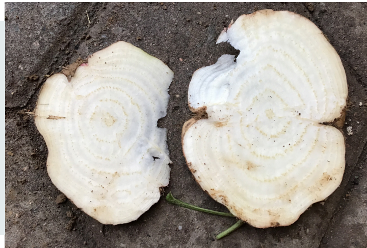
Figuur 5: Typische bruinverkleuring van de vaculaire vaatbundels ten gevolge van SBR

De aanwezigheid van het proteobacterium kan worden bevestigd door middel van PCR-analyses