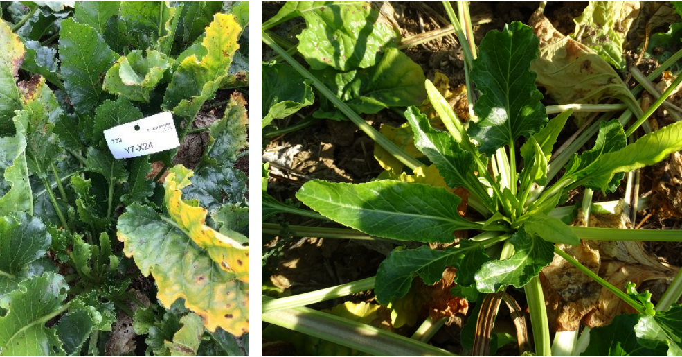
Figuur 3 & 4: Typische bladsymptomen op ouder en jonger blad